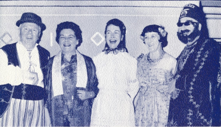
The weekly "Ports of Call" party at The Chantecler is a United Nations General Assembly in miniature. La soirée hebdomadaire "Ports d'Escale" au Chantecler est une assemblée des Nations Unies en miniature.