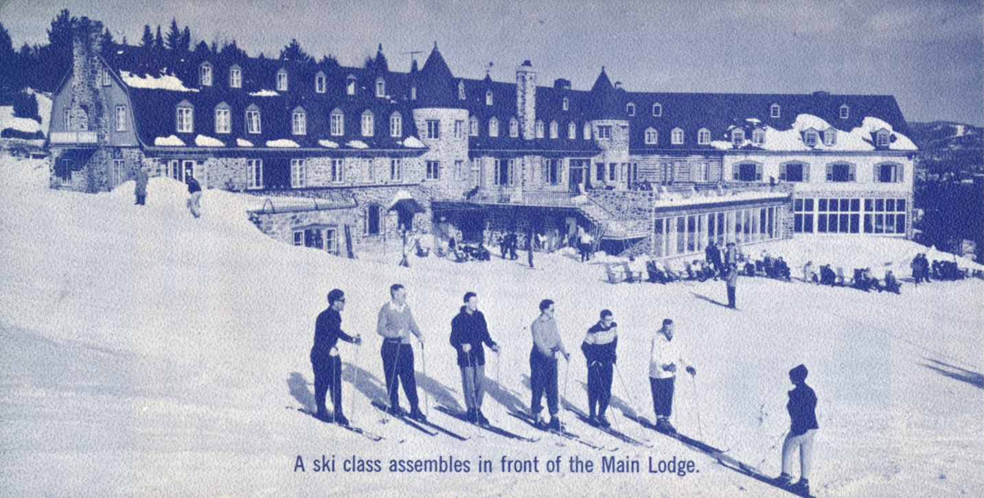
A ski class assembles in front of the Main Lodge.